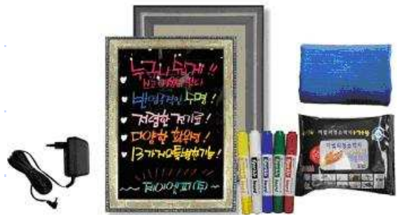
スパークルボード 13種類のネオンサインで注目度UP！