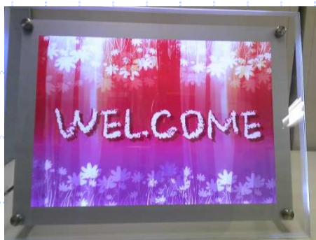
明るい省エネライトパネル