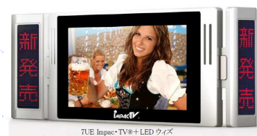
7インチ 電子POPにLEDで文字 が流れ新商品をPR