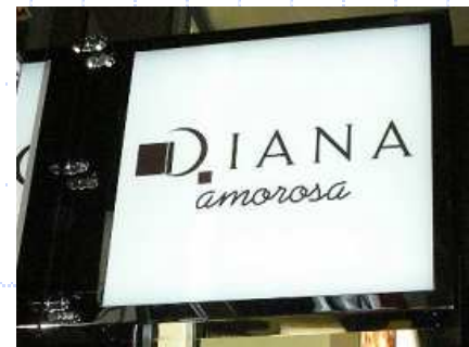
導光板両面看板で低消費電力 &きれいな面発光