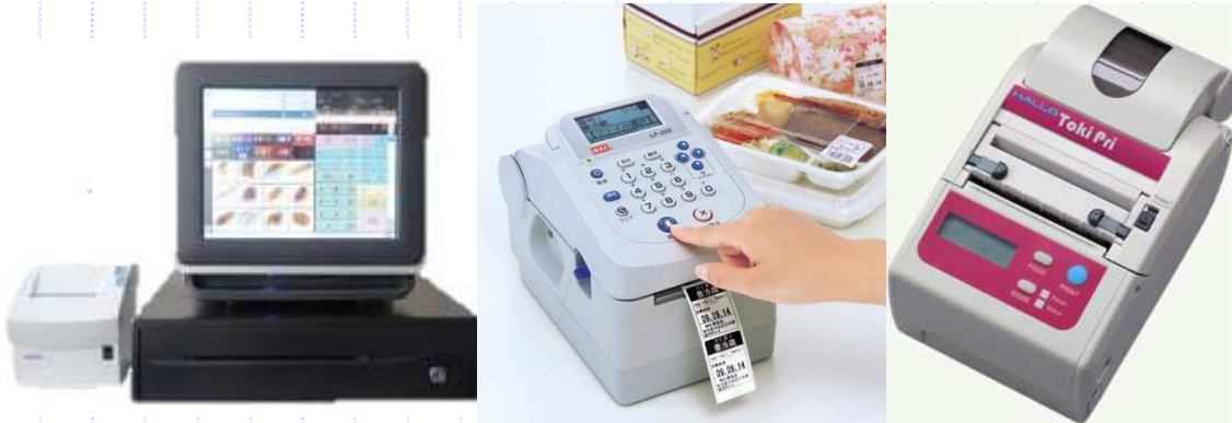
タッチパネルレジ、各種食品表示 ラベルプリンタ