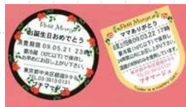
オリジナルラベル