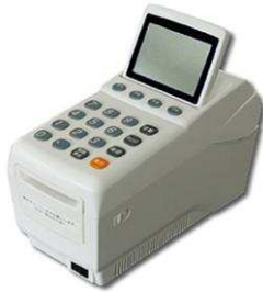
リライト式 ポイントカード発行機