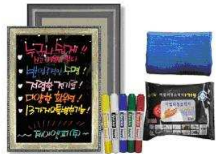
スパークルボード 13種類のネオンサインで注目度UP！