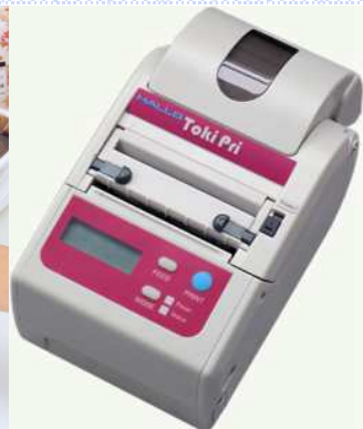
タッチパネルレジ、各種食品表示ラベルプリンタ

お渡し日時：2010.1.31 18時 要冷蔵（10℃以下）で保存し お早めにお召し上がり下さい