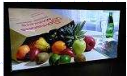
導光板看板で低消費電力 & きれいな面発光！