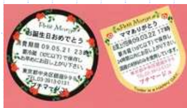
オリジナルラベル