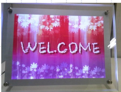
省エネライトパネル メッセージを発信