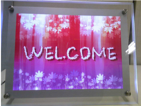
明るい省エネライトパネル