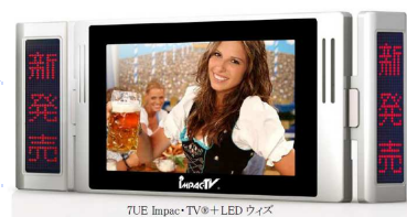
7インチ 電子POPにLEDで文字 が流れ新商品をPR