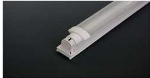
節電対策には、 省エネ CCFL蛍光ランプ