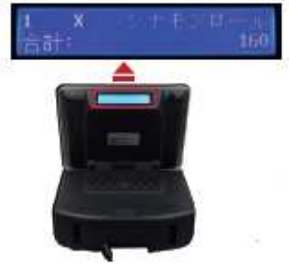
『お客様向け釣銭表示機』

商品画像を登録し、タッチするだけで簡単にレジ入力ができます。もちろん、バーコードのスキャンによる入力も可能。 外国人アルバイトさんのために表示言語の切り替えも可能です。